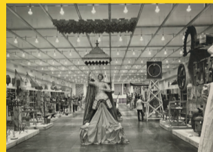
ESTAÇÃO TRIANON-MASP – VITRINES DO MASP – 10 a 30 ARQUIVO NO TRIANON-MASP Realização: Metrô de São Paulo e MASP Museu de Arte de São Paulo Assis Chateaubriand