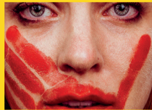
ESTAÇÃO REPÚBLICA – 10 a 30 RIO DE PAZ: “NUNCA ME CALAREI!” Apoio: Over 9k Patrocínio: Duloran Realização: ONG Rio de Paz - www.riodepaz.org.br