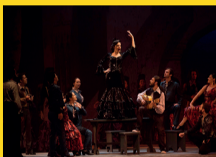
ESTAÇÃO MARECHAL DEODORO – 10 a 30 VITRINE DE FIGURINOS DE ÓPERAS Apoio: Metrô de São Paulo Parceria: Teatro São Pedro Realização: Instituto Pensarte - www.pensarte.org.br