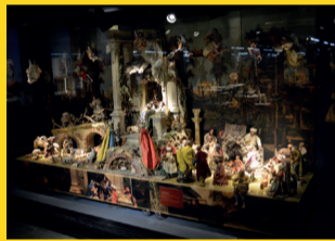
ESTAÇÃO TIRADENTES – 10 a 30 MUSEU DE ARTES SÁBIA – SALA METRÔ TIRADENTES EM BUSCA DO PRESEPIO UNIVERSAL Patrocínio: Banco Sábio Realização: Secretaria de Estado de São Paulo Secretaria de Cultura / Secretaria dos Programas, Bens Patrimoniais, Museu de Arte Sábio / Associação Museu de São Carlos de São Paulo (SAMUSC)