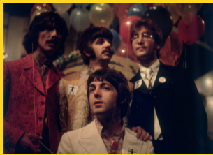
ESTAÇÃO SÉ – 10 a 30 BEATLES: UMA INCRÍVEL HISTÓRIA DE SUCESSO POR MEIO DE IMAGENS Artista: Decarpix Patrocínio e Realização: Getty Images