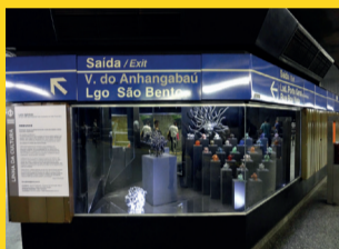
ESTAÇÃO SÃO BENTO – VITRINE SÃO BENTO – 10 a 30 MEDUSAS Artista: Lara Iglesias Curadoria: Oscar D'Ámbrosio Produção Executiva: Fábio Galeazzo Patrocínio e Realização: Cia Arte Cultura - www.ciaartecultura.com.br