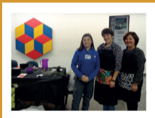
ESTAÇÃO SANTANA – dia 22 – 12h OFICINA DE IKEBANA Montagem de arranjo de Ikebana Patrocínio: Yakult Realização: Metrô de São Paulo e Associação de Ikebana do Brasil