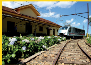
ESTAÇÃO VILA PRUDENTE – 10 a 30 ESTRADA DE FERRO CAMPOS DO JORDÃO Apoio: Metrô de São Paulo Realização: Secretaria dos Transportes Metropolitanos Estrada de Ferro Campos do Jordão