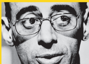
ESTAÇÃO REPÚBLICA – MUSEU DA DIVERSIDADE SEXUAL – 11 a 30 CAIO, MON AMOUR Curadoria: Paulo Dip Espetrografia: Zel Design Execução: APAA / Museu da Diversidade Sexual Realização: Secretaria de Cultura do Estado de São Paulo