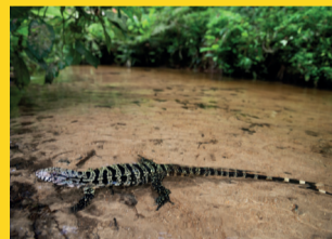
ESTAÇÃO CLÍNICAS – 10 a 30 FLORESTA VIVA Apoio: Votorantim S.A. Produção executiva: Danilo Santilli Agradecimentos: Bruno Portela Realização: Legado das Águas - Reserva Votorantim