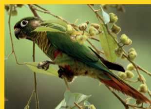
ESTAÇÃO SÃO BENTO – 10 a 30 AVES DA MATA ATLÂNTICA Patrocínio: Programa Patrobras Socioambiental Realização: Agência Ambiental Pick-up - www.pick-up.org.br