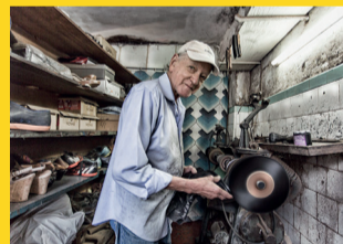
ESTAÇÃO PARAÍSO – 10 a 30 INVISÍVEIS – MEMÓRIA DE UM COTIDIANO Realização: Cristiano F. Burmeister www.crisburmeister.com.br