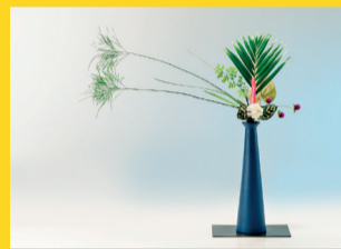
ESTAÇÃO LIBERDADE – 10 a 30 VITRINE DE IKEBANA Patrocínio: Yakult Realização: Metrô de São Paulo e Associação de Ikebana do Brasil