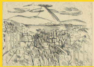
ESTAÇÃO SANTA CECÍLIA – VITRINE LASAR SEGALL – 10 a 30 LASAR SEGALL E O RIO Artista: Lasar Segall Realização: Metrô de São Paulo e Museu Lasar Segall