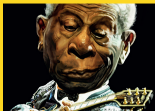
ESTAÇÃO SANTA CECÍLIA – 10 a 30 NA LINHA DO HUMOR www.coleteatros.com.br Realização: Prefeitura Municipal de Piracicaba Secretaria Municipal de Ação Cultural Centro Nacional do Humor Gráfico de Piracicaba