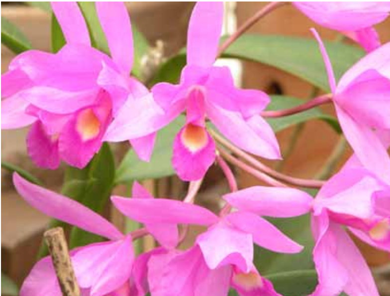
Pomar Urbano - (margens do Rio Pinheiros)

O CONSEMA é composto pela Presidência, Secretaria Executiva, Plenário, Comissões Temáticas e Câmaras Regionais.