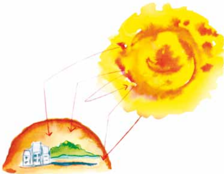
Ilustração: Diamani Regina de Paulo.

Ao redor da Terra há uma camada de um gás chamado ozônio (O 3 ), que protege os seres vivos dos raios ultravioleta emitidos pelo Sol. Na superfície terrestre, o ozônio contribui para agravar a poluição do ar das cidades e a chuva ácida; mas, na estratosfera, é um filtro a favor da vida. A camada de ozônio se localiza em uma faixa que vai dos 20 aos 34 Km de altitude no equador e dos 14 aos 30 Km de altitude sobre os pólos, na estratosfera 100 . Em 1977, cientistas britânicos detectaram pela primeira vez a existência de um buraco na camada de ozônio sobre a Antártida.