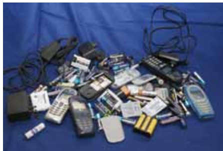
Foto: Lixo eletrônico

Na Eco-92, consolidou-se como um dos fatores da insustentabilidade mundial os estilos de vida e de consumo. Contudo, na ocasião considerou-se que qualquer influência na autonomia dos consumidores seria considerada violação dos direitos e das liberdades individuais. Sendo assim, mudar os padrões de consumo, e não os níveis de consumo, passou a ser o objetivo principal, entendendo também que o consumo é o motor para o crescimento econômico. 72