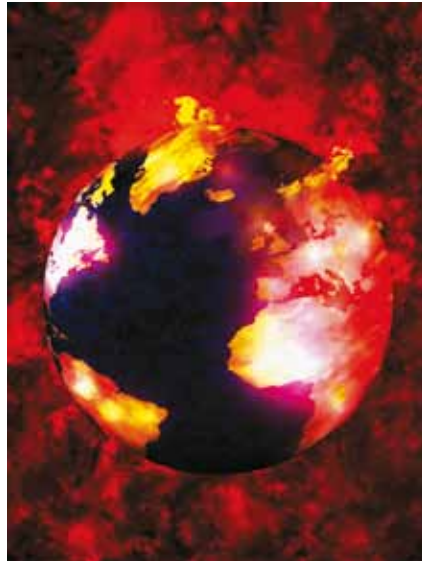
Imagem: Secretaria do Meio Ambiente

I. A compatibilização do desenvolvimento econômico-social com a proteção do sistema climático;