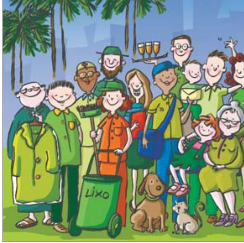
Várias atividades foram programadas em todo o Estado de SP

No dia 21 de setembro, o Parque Villa-Lobos, em São Paulo, terá uma programação especial para o Mutirão Verde. O evento contará com diversas atividades sobre o tema ambiental, distribuídas em dez tendas na entrada do parque e será direcionado para crianças do ensino fundamental da rede pública. O público do parque também será incen-