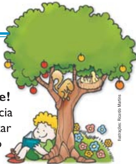
Ilustrações: Ricardo Martins

ONGs: entidades ambientalistas unidas por uma causa comum