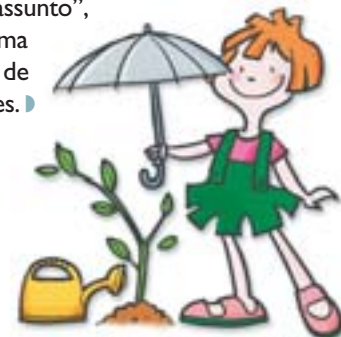
No Parque Villa-Lobos, em São Paulo, ocorrerá um dos eventos do primeiro Mutirão Verde