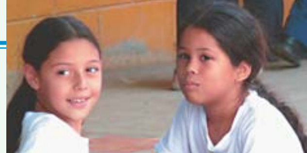
Seis milhões de alunos incentivados a participar

Neste ano, as ações continuaram e foram ampliadas com a construção de uma estufa para a produção de mudas nativas e frutíferas